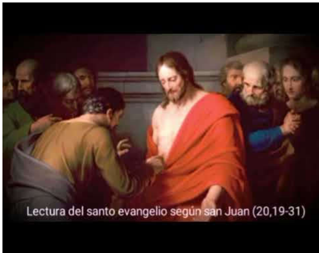
Lectura del santo evangelio según san Juan (20,19-31)